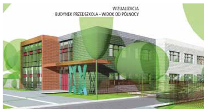
fot.: Artur Cebula Anna Kunkel Architekci