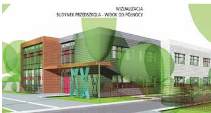
fot.: Artur Cebula Anna Kunkel Architekci