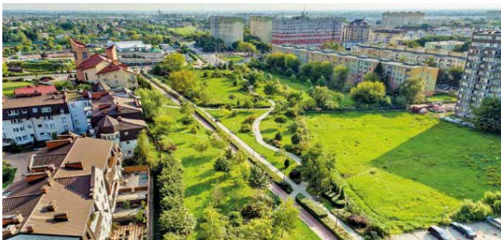
Panorama Ursusa. Widok od strony parku Hassów.

To będzie budżet rekordowy, większy od tegorocznego o 15%. Zgodnie z przyjętymi ustaleniami według stanu na dzień 30 października 2016 roku prognozowane łączne wydatki budżetowe Dzielnicy Ursus m.st. Warszawy w 2017 roku przekroczą 247 mln zł. Na wydatki majątkowe, czyli na nowe oraz kontynuowane inwestycje przewidziano aż 72 mln zł. Pozostałe prawie 175 mln zł – tu też będzie wzrost o 5% – to wydatki bieżące, czyli środki na realizację wszystkich zadań zarówno Urzędu Dzielnicy, jak i podległych jednostek. Przedstawiamy najważniejsze pozycje budżetowe.